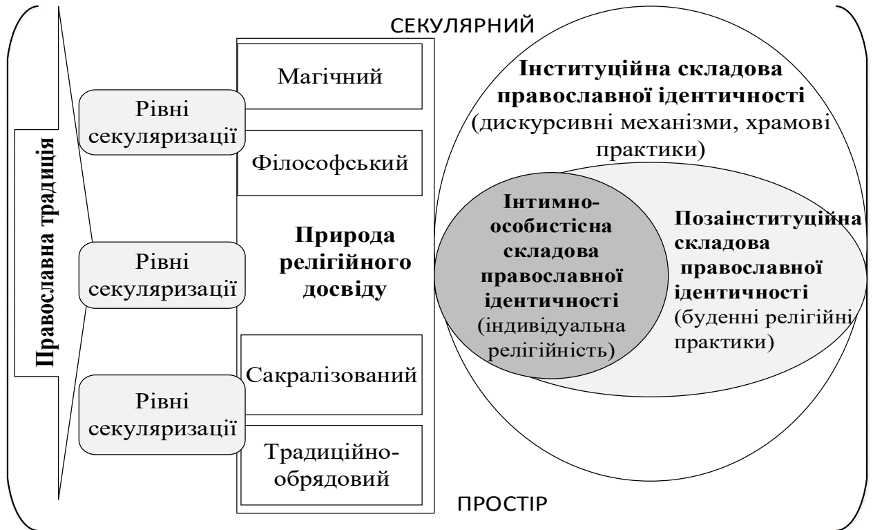
Рис.1. Модель конструювання православної ідентичності в секулярному просторі

інституційних основ православної традиції людина отримує готову світоглядну модель у вигляді вірувань та догматів, а також сталі поведінкові практики.