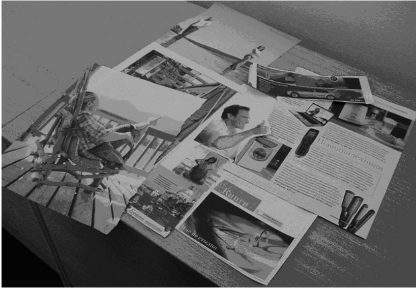
Рис. 3. Колаж “Моє майбутнє через 10(5) років” представниці юнацької аудиторії майстер-класу

Це пояснюється передусім тим, що культура самоаналізу та особистісної рефлексії у більшості з нас практично не сформована. У нас немає ні традицій, ні навчальних дисциплін, які навчали б змалку, з раннього віку працювати над власним майбутнім. Звичайно, усі це по змозі роблять. Однак роблять хаотично, ситуативно, імпульсивно. Зрозуміло, що результати здебільшого не задовольняють особистість, проте цей факт проявляється через роки, а то й десятиліття марної щоденної метушні.