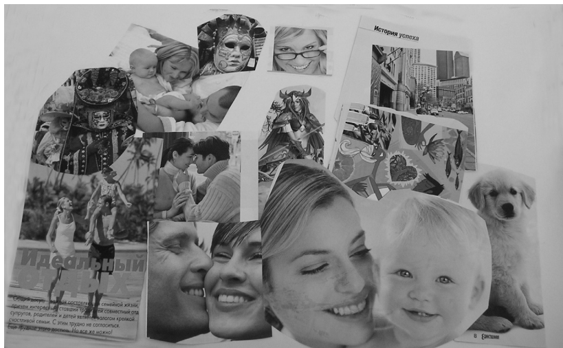
Рис. 2. Колаж “Мое майбутнє через 10(5) років” представниці юнацької аудиторії майстер-класу

добрає пошук автором власної ідентичності. Мультиплікаційні герої, використані в колажі, підкреслюють фантазійну природу уявлень про себе. Основна тематика – відносини і трохи успіху – теж стандартна. У цьому віці, як і в підлітковому, особистість ще не усвідомлює власної унікальності.