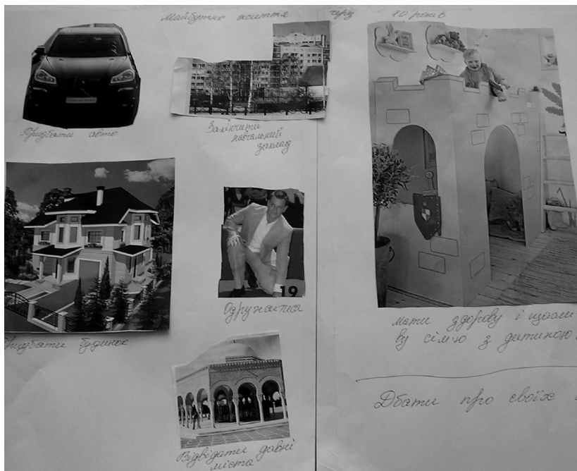
Рис. 1. Колаж “Мое майбутнє через 10(5) років” представниці підліткової аудиторії майстер-класу

Пропонуємо розглянути три колажі, створені учасниками майстер-класів. Автор першого колажу – учениця 9-го класу (15 років). Її твір є прикладом того, як будують своє майбутнє підлітки. А воно, майбутнє, складається для них з типового “набору”: мати будинок, машину, диплом, закордонний паспорт, чоловіка і дитину. У центрі майбутнього – чоловік, який найчастіше і стає стрижнем формування жіночої ідентичності (рис. 1).