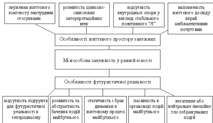
Рис. Теоретична модель дослідження особливостей футуристичних автонаративів залежних особистостей

ративи залежних та автономних особистостей, а саме: 1) специфічність підґрунтя футуристичної реальності, 2) розмитість та абстрактність бачення подій майбутнього, 3) статичність і брак динаміки в життєвому процесі, 4) пасивність в організації подій майбутнього, 5) негативне або нейтральне емоційне тло зображуваних подій (рис.).