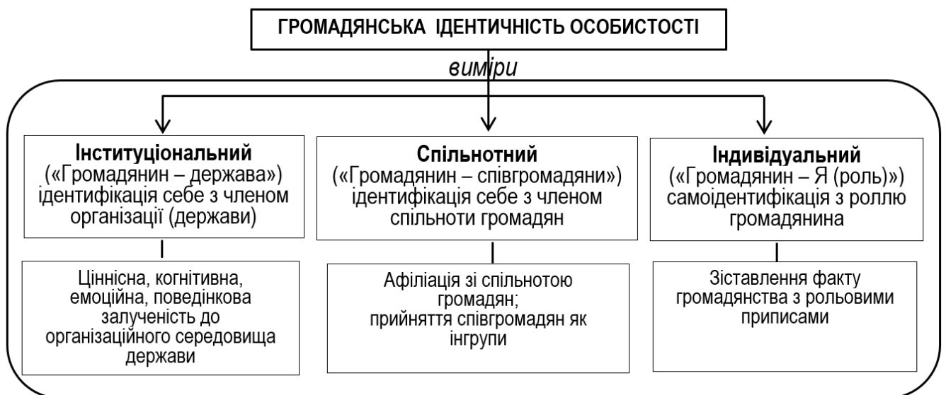
Рис. 1. Виміри громадянської ідентичності особистості

Громадянська ідентичність як особистісне утворення має три виміри: інституціональний, спільнотний та індивідуальний (рис. 1).