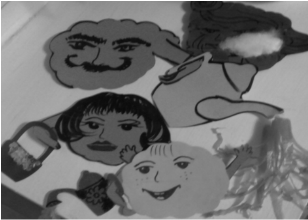
Рис. 1. Приклад використання заняття «Родина хмаринок»

Цінність використання таких проєктивних методик у роботі з дітьми з захворюваннями опорно-рухового апарату та ураженням центральної нервової системи – в тому, що малюнкові матеріали й предмети ігрової діяльності (в нашому випадку – площинні зображення хмаринок) є для дитини більш важливими і цікавішими партнерами комунікації, ніж арт-терапевт. Дитина проявляє щодо них характерні для себе і пов'язані з особистим досвідом способи побудови стосунків, ті чи інші емоційні реакції, у яких очевидні прояви переносу. Мислення дитини більш образне й конкретне, ніж мислення більшості дорослих, тому вона використовує образотворчу діяльність як спосіб осмислення дійсності і своїх взаємовідносин з нею [2]. За допомогою даної методики у арт-терапевта з'являється можливість дізнатися суб'єктивну думку дитини про її місце у родині, емоційне ставлення до родичів, визначити спектр роботи та запланувати корекційні заходи. Проте важливим залишається врахування особливостей психофізичного розвитку дітей та їх образотворчих можливостей. Лише такий цілісний підхід забезпечить цілісний та гармонійний психолого-педагогічний супровід дітей з особливими потребами.