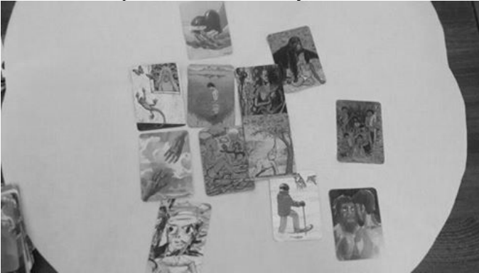
Рис 1.1. Робота клієнта М-ої Н.В. «...і Я така»

Наведемо один із коментарів дружини ветерана АТО: «Завдяки такій роботі із картами відбулося усвідомлення стосунків із своїми близькими людьми і тим, яку роль вони виконують у моєму житті. Особливо важливим відкриттям було виявлення свого внутрішнього стану. Вибрані карти дали змогу усвідомити, що насправді коїлося в моїй душі, а також що можна було вільно про це говорити, і, з огляду на виявлену проблему, прийшло розуміння, що потрібно робити для того, щоб досягти врівноваженого стану».