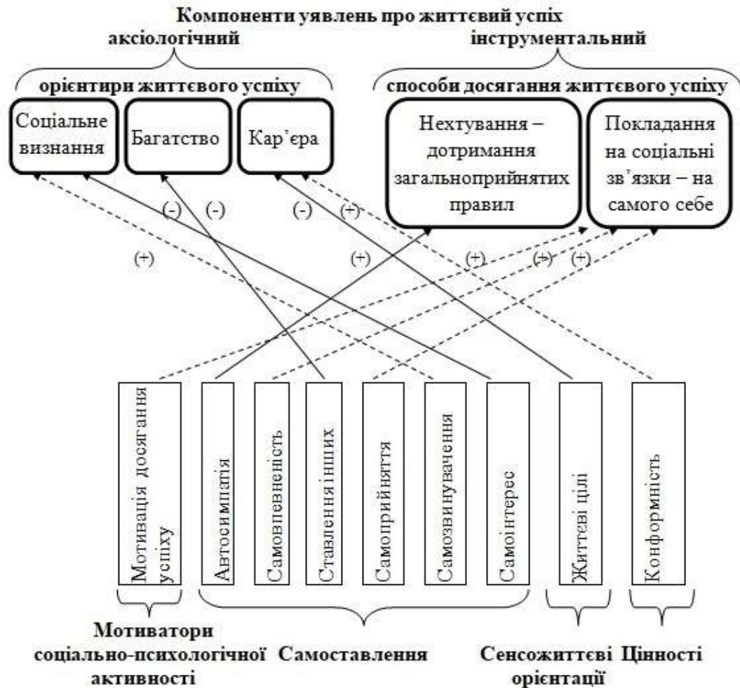
Рис. 2. Соціально-змістовий напрям вироблення уявлень про життєвий успіх у молоді з досвідом невдач

полягають у тому, що досвід невдач зумовлює вплив негативних особистісних властивостей на зміст аксіологічного компоненту уявлень (рис.2).