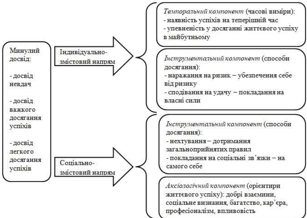
Рис. 1. Напрями вироблення молоддю уявлень про життєвий успіх

аксіологічний, зміст якого становлять орієнтири життєвого успіху, і частково інструментальний, що містить способи досягання успіху, серед яких нехтування або дотримання загальноприйнятих правил і покладання на соціальні зв'язки або на самого себе. Соціально-змістовий напрям вироблення уявлень про життєвий успіх поєднує вплив особистісних чинників на соціальні за характером компоненти уявлень. Найбільш чутливими орієнтирами життєвого успіху, що становлять аксіологічний компонент уявлень і підпадають під їхній вплив, виявилися добрі взаємини, соціальне визнання, багатство, кар'єра, професіоналізм і впливовість (рис.1).