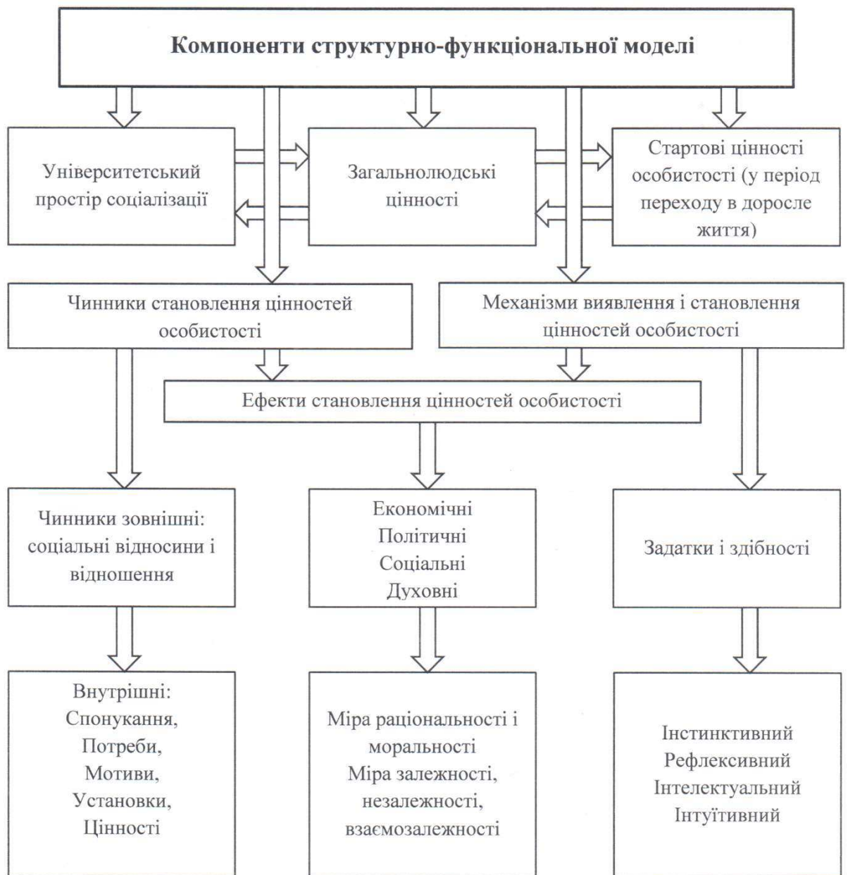
Рис. 1. Компоненти моделі становлення цінностей особистості в сучасній молоді

В якості провідного механізму становлення особистісних цінностей ми розглядаємо інтеріоризацію. Становлення цінностей – це діалектичний процес, який здійснюється в межах опозиції «привласнення-відчуження». Особистість, обираючи з об’єктів світу та їх суб’єктивних репрезентацій відповідні власній структурі та оминаючи невідповідні, «привласнює» те, що першопочатково було чужим та зовнішнім по відношенню до її внутрішнього світу, інтеріоризує їх. Цей процес триває постійно, протягом