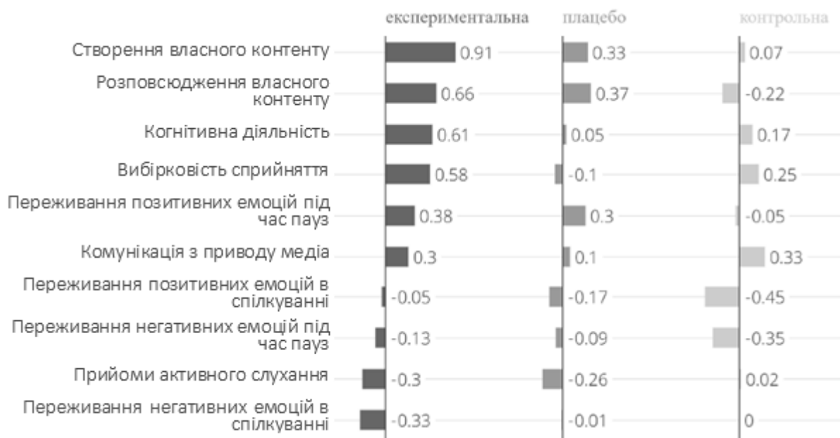
Рис. 2. Порівняння сили ефекту формуючого впливу в групах досліджуваних за показниками анкетування

Позитивний вплив, що відповідає меті тренінгу, був виявлений у показниках «творчого критерію онлайн-активності» ( d=0,78 ) та його елементів «створення власного контенту» ( d=0,58 ) та «розповсюдження власного контенту» ( d=0,29 ). Позитивних змін також зазнав «когнітивний критерій онлайн-активності» ( d=0,59 ). Внаслідок тренінгу досліджувані стали переживати менше негативних емоцій при онлайн-спілкуванні ( d=0,32 ).