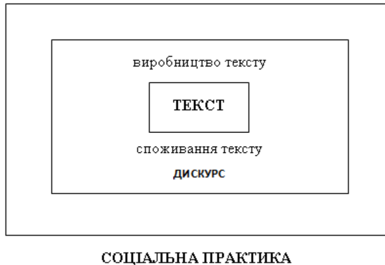
Рис. 2.1. Тривимірний модель критичного дискурс-аналізу Нормана Феркло.

Головна риса КДА – позначення подвійної природи дискурсу та усвідомлення того, що він перебуває у діалектичних відносинах з соціальним світом. Дискурс впливає на соціальну реальність та водночас відображає її, становить соціальну практику і будується завдяки їй, відповідно, для його розуміння надзвичайно важливим є саме контекст [161, с. 66].