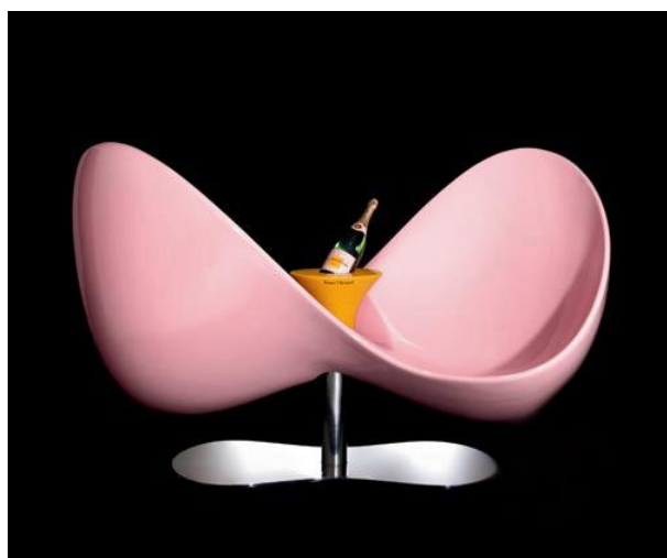
Рис.2. Карим Рашид, интерьер Smart-ologic Corian Living, фото

Забывать о стиле, думать об удобстве. Осознать роскошь свободы вместо роскоши материального. В этом ключ к пониманию сути творчества и мировосприятия Карима Рашида. Беззаботность чистых и ярких цветов, гладкие глянцевые поверхности, простые и мягкие очертания. Несколько лет назад Карим Рашид исключил из своего гардероба черный цвет, теперь его фавориты — белый и розовый.