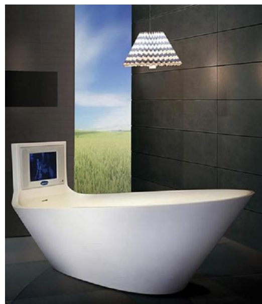
Рис.6. Карим Рашид, концепт ванны со встроенным телевизором, 2009, фото

Карим Рашид – натурально воплощение наших представлений о будущем. Он живет в квартире с плазменным экраном во всю стену, четко придерживается расписания, соблюдает вегетарианскую диету и отвечает на каждый e-mail, телефонный звонок или факс в тот же день, несмотря на занятость. Для него нет ничего постоянного, и ему наплевать на материальные ценности. При том, что именно их он постоянно и создает, будучи одним из самых модных и авторитетных дизайнеров современности.