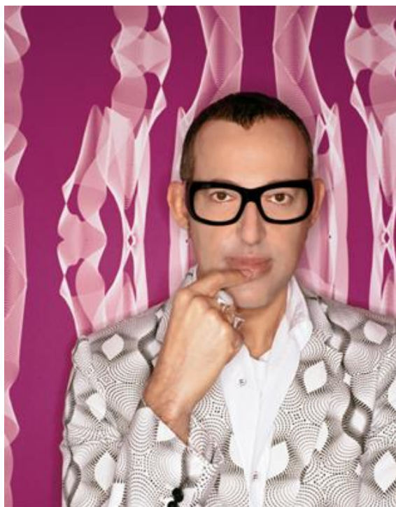
Рис.1. Рашид Карим, фото

Карим Рашид родился в 1960 году в Каире (Египет). Наполовину египтянин (по отцу), наполовину англичанин, Карим рос в Англии и Канаде. В семье было трое детей, художественный вкус Кариму привил отец — художник и театральный декоратор, который любил брать сына на этюды. Промышленному дизайну Рашид обучался в Университете Карлтон в Оттаве. Получив в 1982 году степень бакалавра, продолжил учёбу в Неаполе, а за тем на год переехал в Милан, где стажировался в студии Родольфо Бонетто.